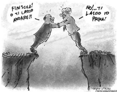
di Staino - luglio 2011