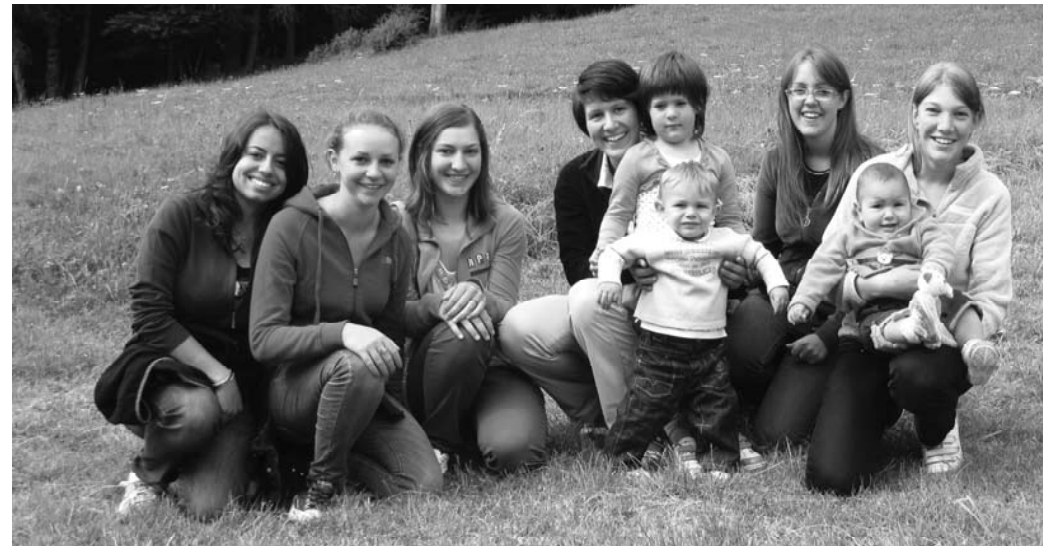
Nella foto: la gioventù al patrono di La Servaz - 26 luglio