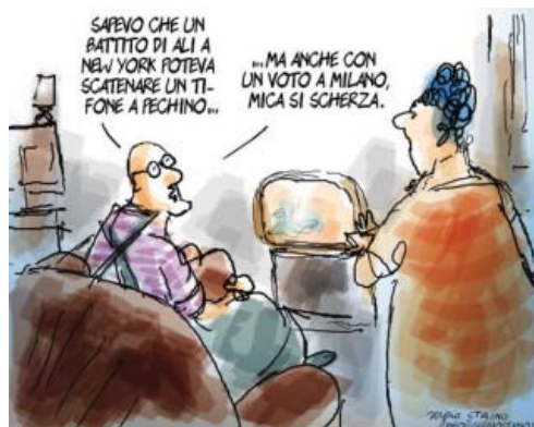
di Staino - maggio 2011