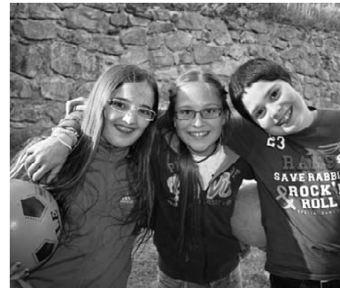
Foto: attività del Gruppo Medie - 4 maggio 2011