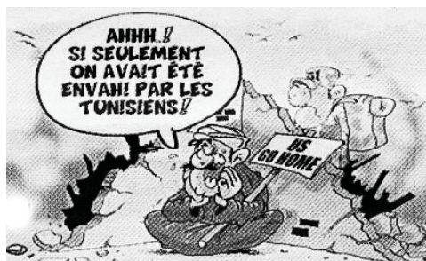
El - Watan - Algeria - febbraio 2011

Les américains n'arrivent toujours pas à instaurer la démocratie en Irak