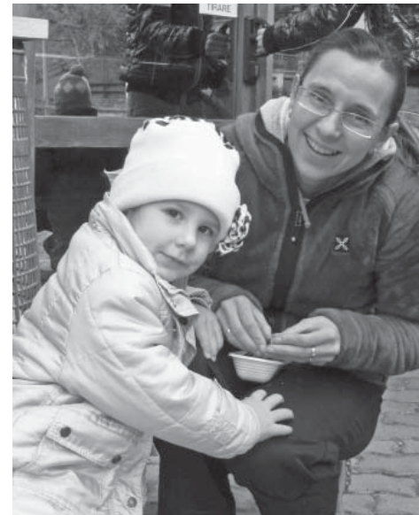
Nella foto: un momento della castagnata

11h00 - Battesimo Surroz Emilie - Arcesaz