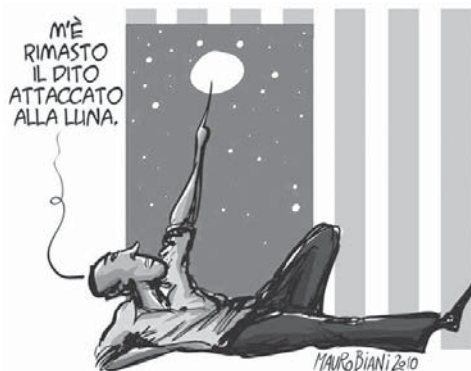
di Mauro Biani - 2010