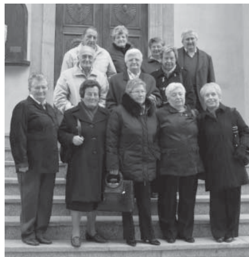
Nella foto: la classe 1939.

7h30 - S. Messa - in sala parrocchiale 10h00 - S. Messa - in chiesa