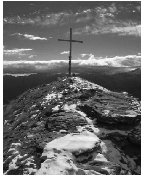
Nella foto: la croce in vetta alla Punta Guà -26/09/10

10h30 - S. Messa in chiesa parrocchiale "restitution" della chiesa restaurata e celebrazione del centenario della nascita del canonico Joseph Bréan