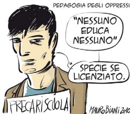
Mauro Biani su Liberazione - agosto 2010