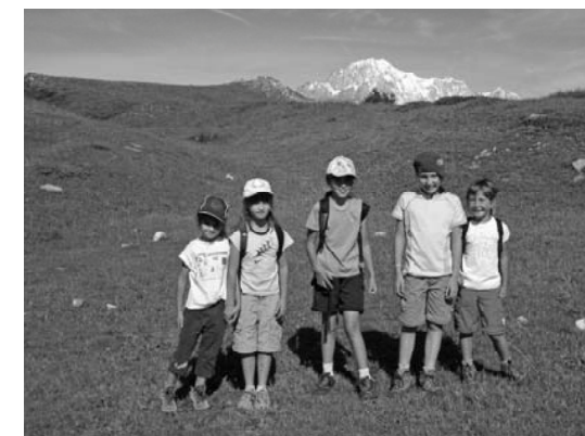
Foto: verso la Punta Olietta con sullo sfondo il Monte Bianco