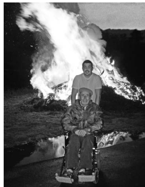
Nelle foto: momenti della boudera ad Extrepierez

La seconda prevede sempre un apprendistato che lo condurrà sulla strada giusta.