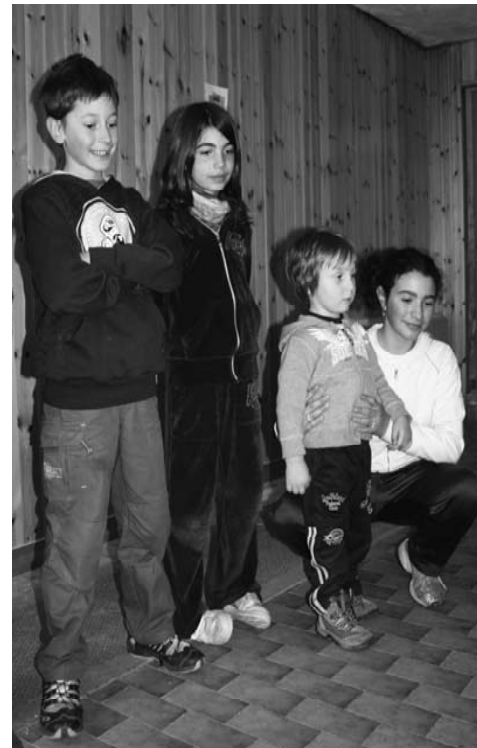
Nella foto: giochi di Shrek

Unità , che ci porta al punto di partenza... il luogo dove noi siamo uniti a noi stessi e a tutte le cose.