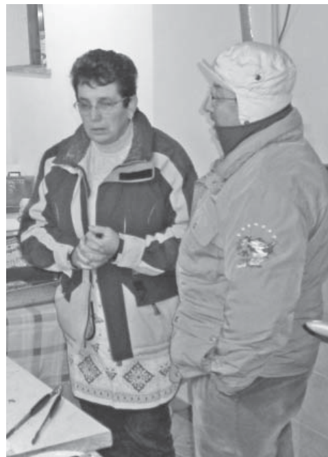
Nelle foto: momenti del Mercatino ad Extrepieraz